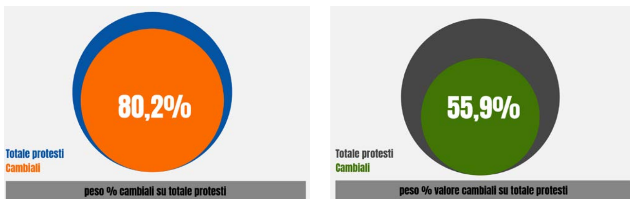
Graf. 2 – Peso % cambiali su totale protesti nei primi nove mesi del 2017 per numero e valore