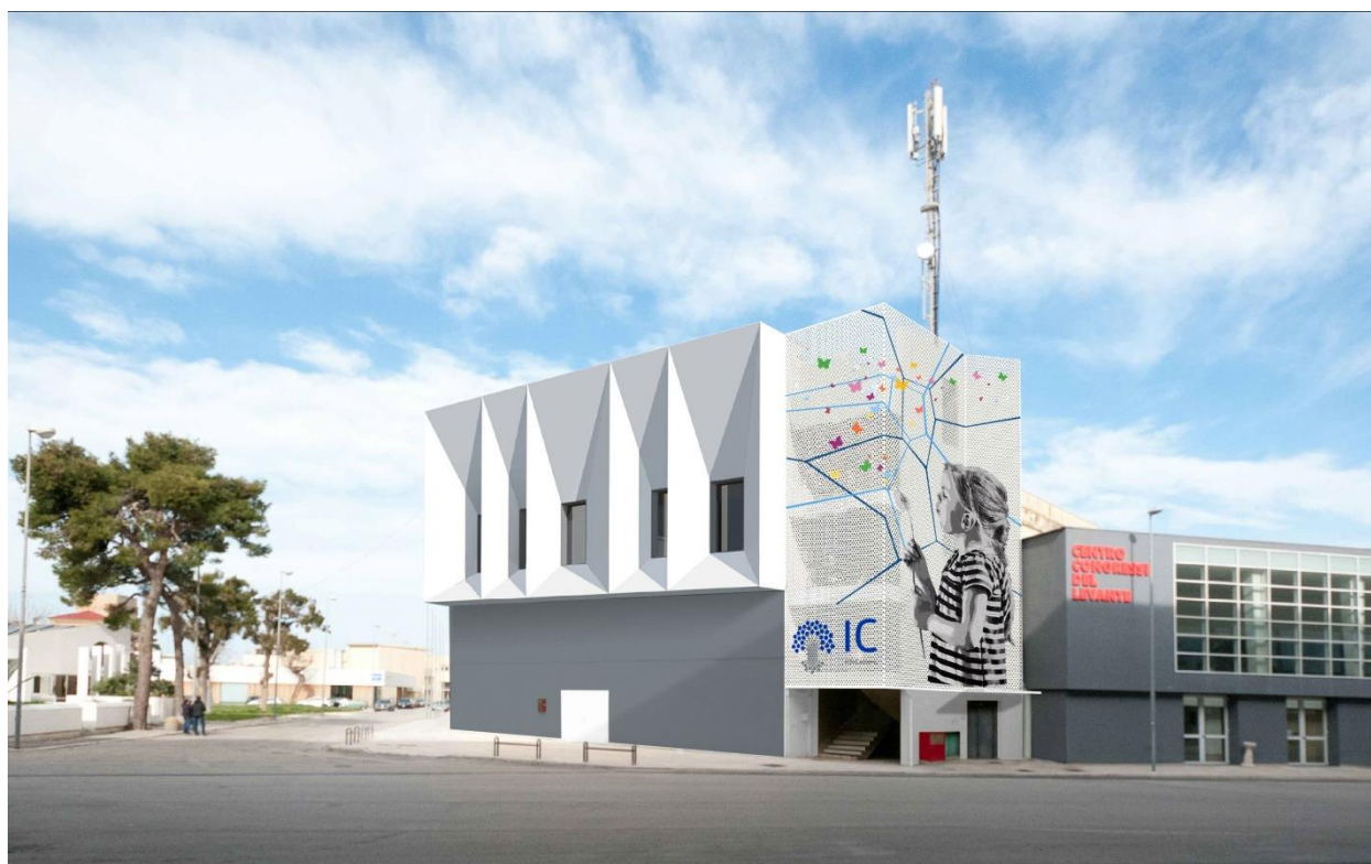
L'esterno della nuova sede di InfoCamere a Bari

Ufficio stampa 06.44285403-310 www.infocamere.it ufficiostampa@infocamere.it