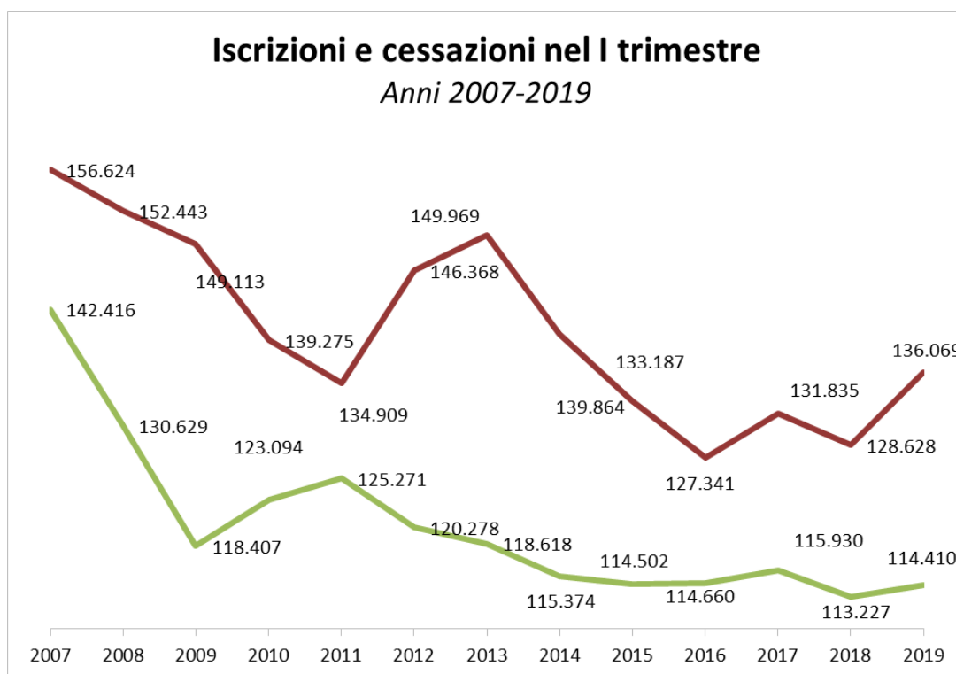
Graf. 1 e 2 - Serie storiche delle iscrizioni, delle cessazioni* e dei saldi nel I trimestre di ogni anno Totale imprese, valori assoluti - Anni 2008-2019