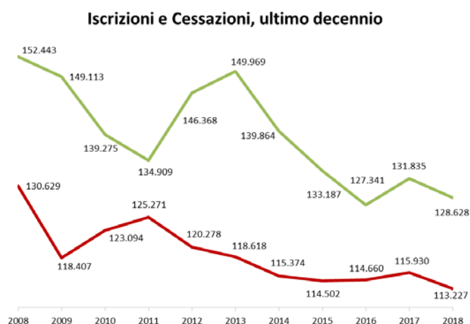
Graf. 1 e 2 - Serie storiche delle iscrizioni, delle cessazioni* e dei saldi nel I trimestre di ogni anno Totale imprese, valori assoluti - Anni 2008-2018

Tra i settori, i saldi positivi più significativi si registrano nelle attività di noleggio, agenzie di viaggio e servizi alle imprese (+1.326 unità, per una crescita dello 0,7%), nelle attività professionali, scientifiche e tecniche (mille un’unità nei primi tre mesi del 2018) e nei servizi di informazione e comunicazione (+580). Rispetto al I trimestre 2017, due tra i tre settori numericamente più consistenti dell’economia evidenziano un’inversione di tendenza, pur continuando a far registrare un segno “meno” davanti al proprio saldo, con perdite dello stock più contenute rispetto a dodici mesi fa: le costruzioni (-0,61% contro -0,67%) e le attività manifatturiere (-0,53% contro -0,57%). Il commercio continua invece ad arretrare perdendo quasi mille unità in più rispetto allo stesso periodo dell’anno scorso: saldo negativo di 9.648 imprese (-0,57% in termini relativi), risultato peggiore di quello del 2017, quando il saldo si attestò a -8.766 unità.